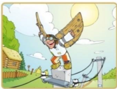
Не лезь на опоры и столбы

Чтобы не подвергать себя риску, запомните простые правила: Опасно для жизни влезать на опоры линий электропередачи, проникать в трансформаторные подстанции или подвалы, где находятся электрические провода