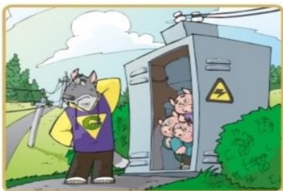
Не лезь на электроустановки и в трансформаторные будки

Чтобы не подвергать себя риску, запомните простые правила: Опасно для жизни влезать на опоры линий электропередачи, проникать в трансформаторные подстанции или подвалы, где находятся электрические провода