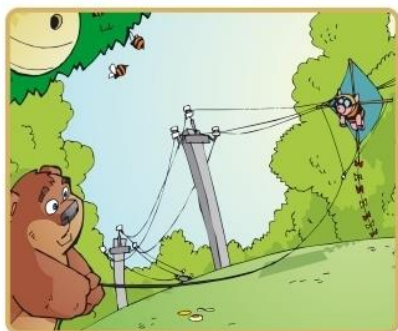
Не бросай ничего на провода и не играй вблизи

Никогда не заходите на территорию и в помещения электросетевых сооружений. Не открывайте двери ограждения электроустановок и не проникайте за ограждения и барьеры. Это может привести к печальным последствиям