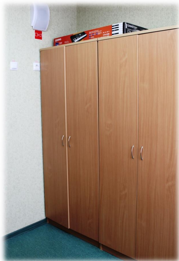
Шкаф для одежды, шкаф книжный.