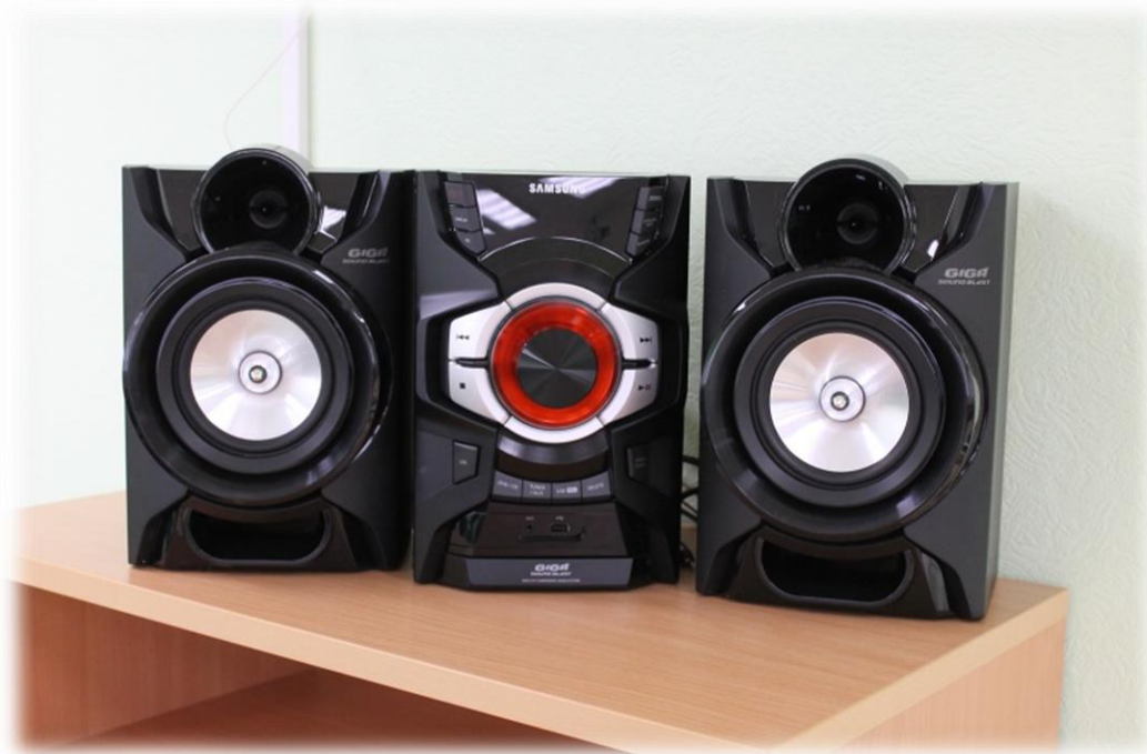
Музыкальный центр «Samsung»