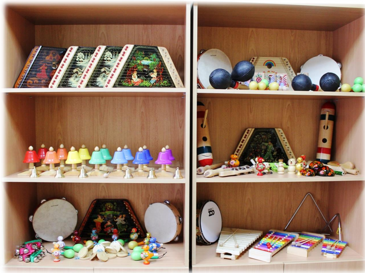
Детские музыкальные инструменты