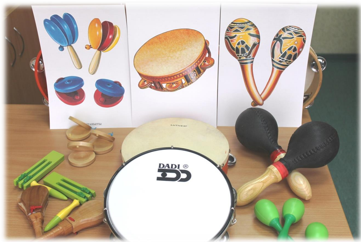
Группа шумовых инструментов