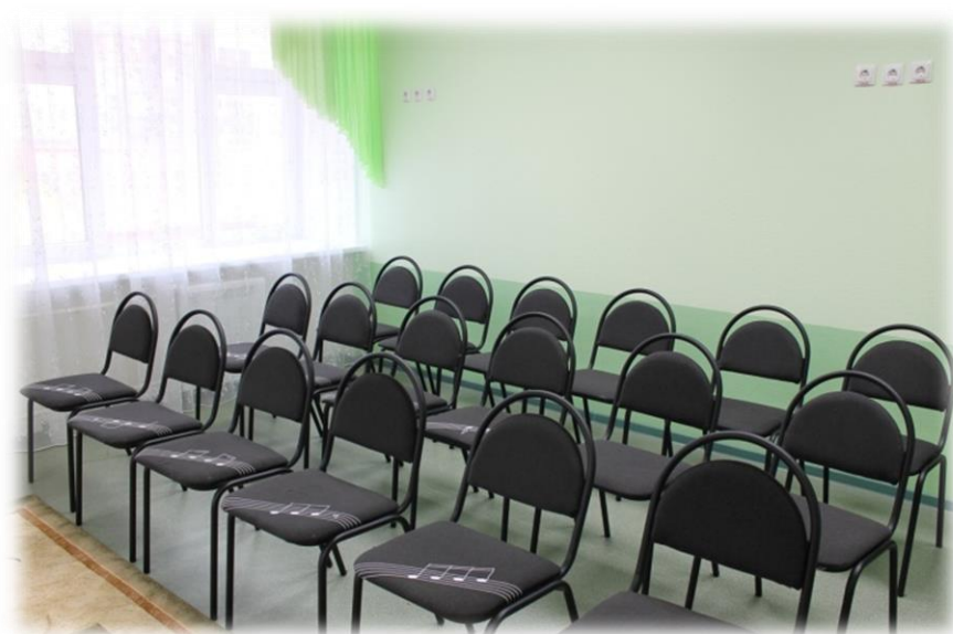
Стулья для зрителей.