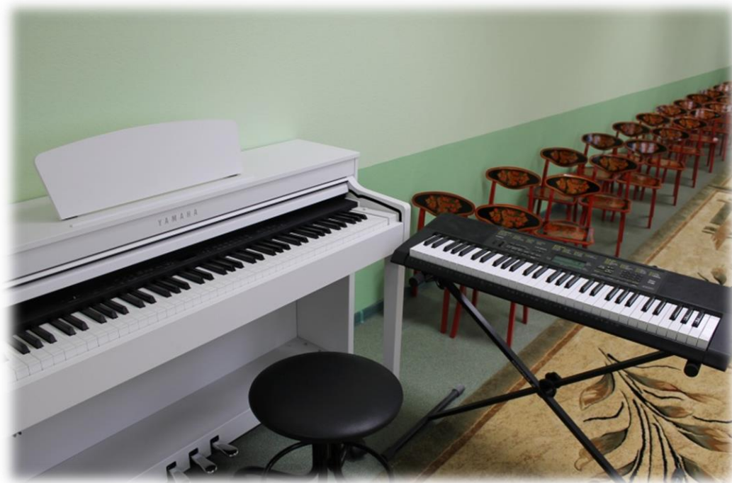
Электронное фортепиано «Yamaha», синтезатор «Casio»